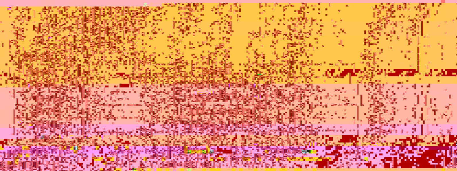
样品类别: 1 2